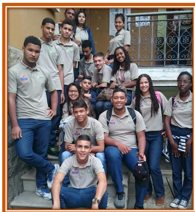
Visita ao Museu do Porto